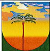
LA PLAINE DES PALMISTES